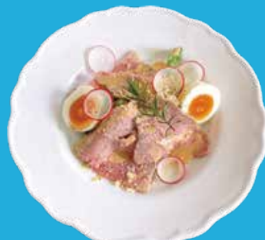
3. 自家製ロースハムサラダ シーザー ドレッシング