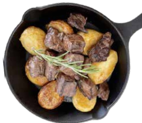
牛ハラミ サイコロステーキ