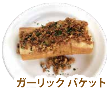
ガーリック バケット