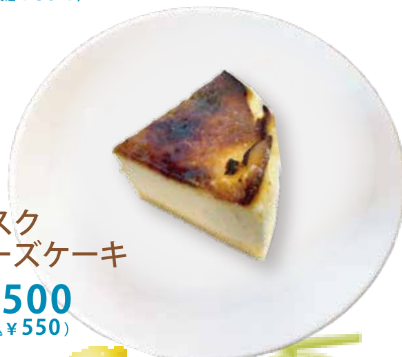
巴斯ク チーズケーキ