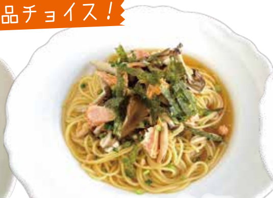
サーモン・キノコ バター醤油スパゲッティ