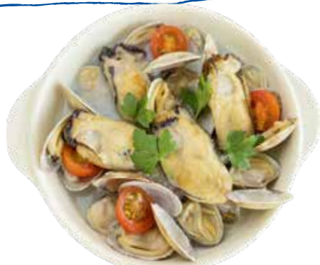
似島産 牡蠣・アサリ アヒージョ