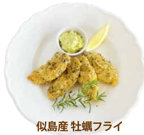
似島産 牡蠣フライ