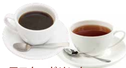
アフタードリンク コーヒー or 紅茶