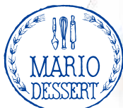
おまかせケーキ 2種盛り