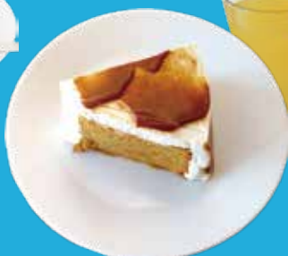
2. キャラメルシフォン