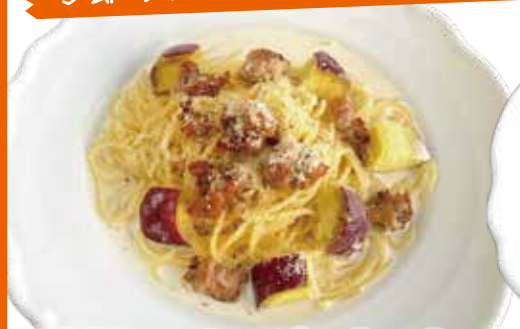
自家製ソーセージ・さつまいも クリームスパゲッティ