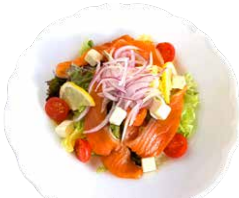
スモークサーモン クリームチーズ サラダ フレンチ ドレッシング