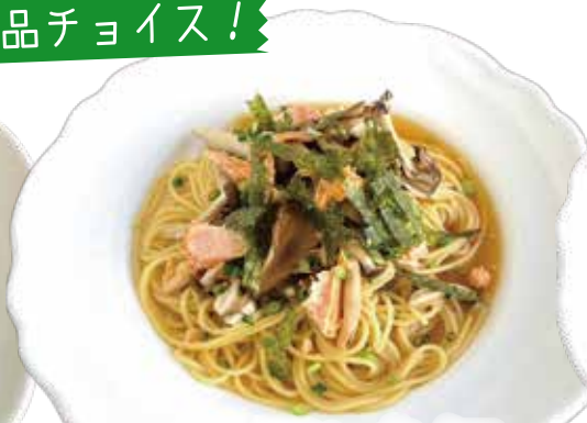
サーモン・キノコ バター醤油スパゲッティ