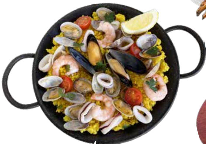
地中海風 パエリア