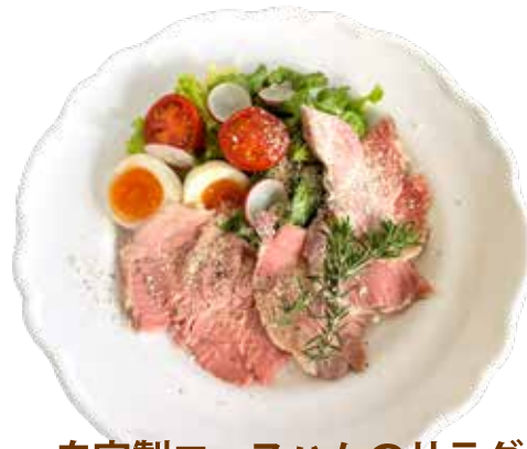
自家製ロースハムのサラダ シーザー ドレッシング