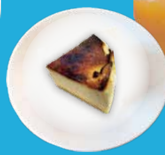
4. バスクチーズケーキ