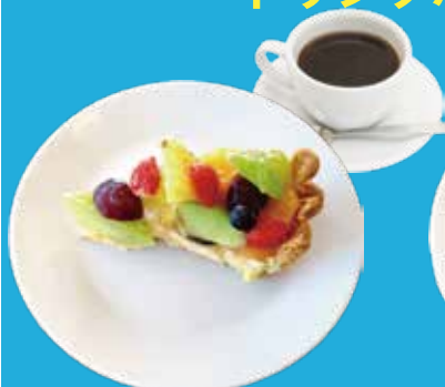
1. 季節のフルーツタルト