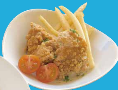
チキンのからあげ & フライドポテト