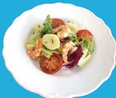
2. エビ・ポテト サラダ バリバリドレッシング