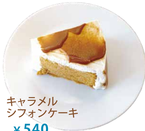
キャラメル シフォンケーキ