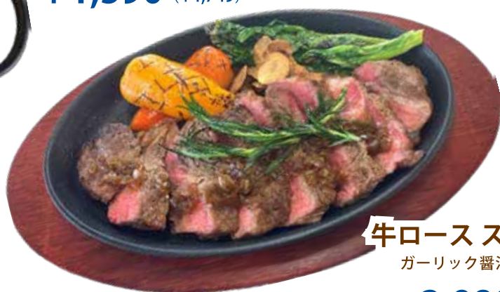
牛ロース ステーキ ガーリック醤油ソース