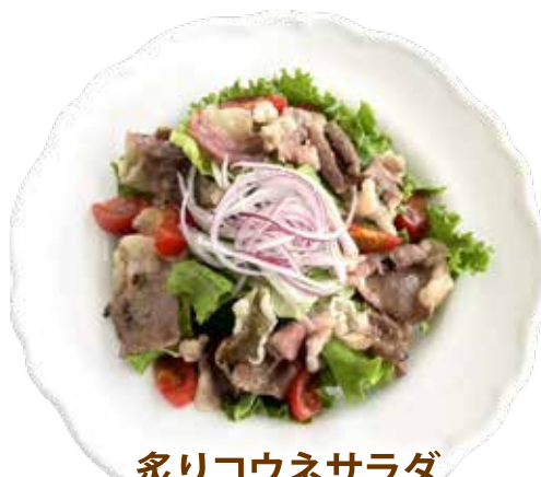
炙りコウネサラダ イタリアン ドレッシング