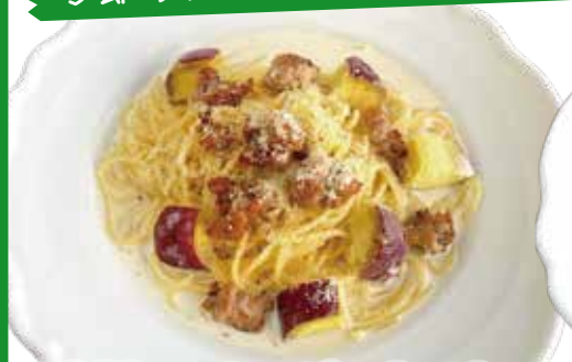
自家製ソーセージ・さつまいも クリームスパゲッティ