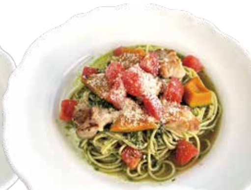
チキン・かぼちゃ トマトベーススパゲッティ