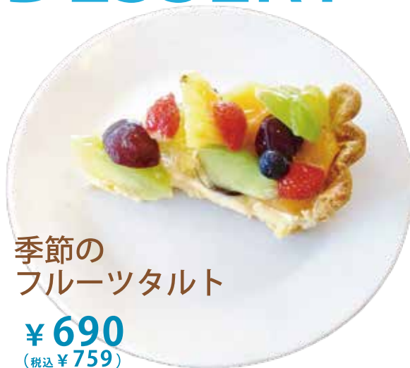
季節の フルーツタルト