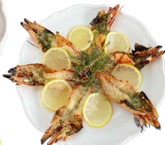
有頭エビのグリル