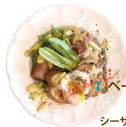
1. ベーコン・半熟卵 サラダ シーザードレッシング