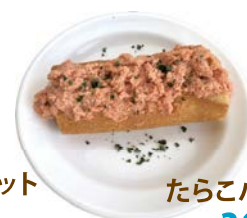
たらこバケット ¥390 (421)