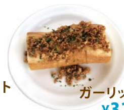
ガーリックバケット ¥320 (346)