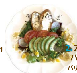
2. アボカド・トマト バケット サラダ パリパリドレッシング