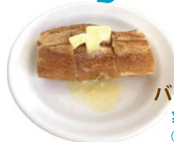
バターバケット ¥290 (税込¥313)