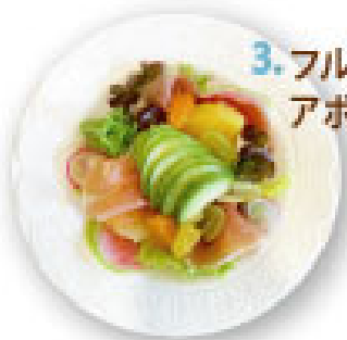
3. フルーツ・サラミ アボカドサラダ