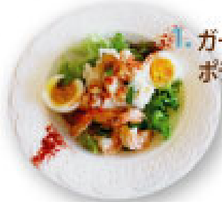
1. ガーリックシュリンプ ポテトサラダ