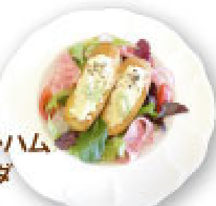
4. チーズバゲット・ハム イタリアンサラダ