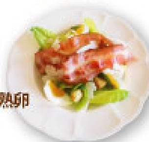
2. 炙りベーコン・半熟卵 シーザーサラダ